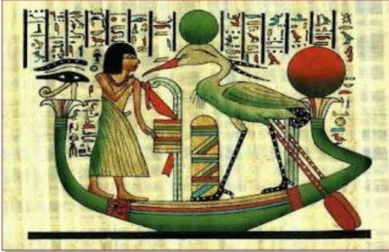
شكل (3) طائر العنقاء بأحد النقوش الجدارية بعهد الفرعنة

وتناولوا العرب طائر العنقاء بمنظور ديني وفي ضوء العقلية الإسلامية التي تحرم الالهة فكل ما نقلوه عن المخلوقات الخيالية إنما نقلوه متأثرين بالعقيدة الدينية اليهودية والمسيحية (خان، 1937). ب- العنقاء عند المصريين القدماء: ربطوا العنقاء بالخلود وكانت لتلك الرمزية جاذبية واسعة النطاق في العصور القديمة فهو رمزاً للأبدية والتي كانت قوية بمحضاراتهم ويدل على الامتياز والشجاعة فصوروه أنه طائر مغطى بريش طويل على أجنحته ومتوج بتاج وكأنه ملك (3) . شكل (3)