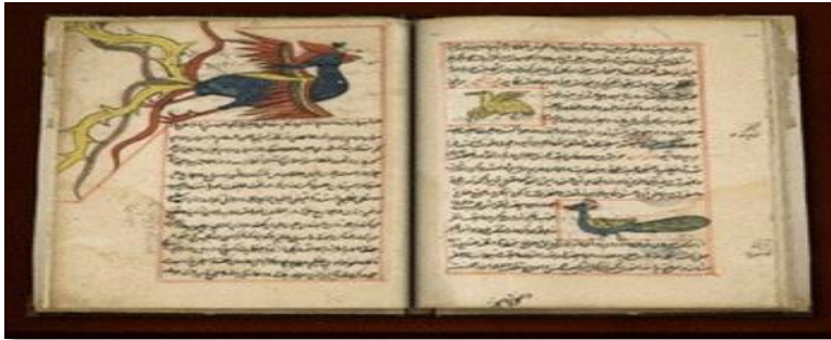
شكل (2) صورة للعنقاء من كتاب عجائب المخلوقات و غرائب الموجودات للقرويني 1203م

أ- العنقاء عند العرب: تناول العرب الأساطير في الشعر والأدب والروايات وذكرت العنقاء في كتاب ألف ليلة وليلة ومن أبرز صفاته أن جسده مغطى بريش جميل ملون بالأحمر والذهبي وله ذيل طويل، شكل (2).