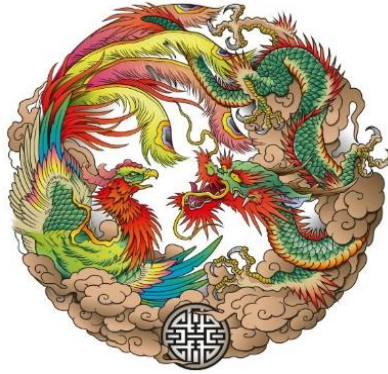
شكل (5) صورة العنقاء