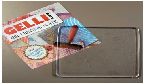
شكل (8) قالب الجلي بليت الطباعي

تضم الطباعة المستوية عدد من التقنيات: lithography, monotype, وتضم تقنية lithography عدد من التقنيات: Paper, Offset printing, Waterlees printing, Stone lithography, lithography, gelli plate printing. وسنقوم في التجريب بتناول تقنية gelli plate printing. شكل (8) وهي تشابه في طريقتها تقنية monotype.