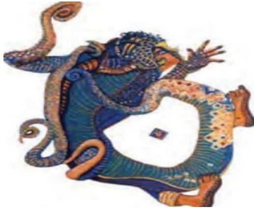
شكل (1) جينات لارا

يعيش في بستان جميل ملئ بالأشجار والأزهار، ويغني بصوت جميل مرددًا بعض الأغاني، كما أنه لا يشيخ بل ويستطيع أن يعود للحياة مره أخرى بعد موته (الشهري، 2019)، ومن الأمثلة أيضًا طائر الرخ ذلك الطائر الأسطوري هائل الحجم، ورد ذكره في كتاب ألف ليله وليله في رحلات السندباد، ومن بعض أبرز صفاته إنه عظيم الخلق، كبير الجثة، عريض الأجنحة، إذا طار غطى عين الشمس وحجبها عن الجزيرة فاخفتت الشمس، وأظلم الجو، وغير ذلك مما يضيق عنه المجال (بلقاسم، 2019: 44-45). فهذه الطيور بصفاتها الخيالية تعد مصدرًا خصبًا للإلهام والابداع لابتكار أعمال طباعية بتقنيات الحفر الغائر والبارز والمستوية. والفنانة شادية عالم هي من أبرز الفنانين السعوديين التي اعتمدت على الأساطير في رسوماتها. شكل (1)