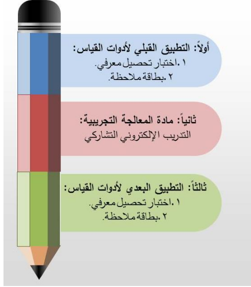
شكل (1) التصميم التجريبي للبحث

استخدم هذا البحث التصميم التجريبي ذي العينة الواحدة والذي يعتمد على مقارنة نتائج أفراد عينة البحث قبل وبعد التطبيق، ويوضح الشكل التالي التصميم التجريبي للبحث: