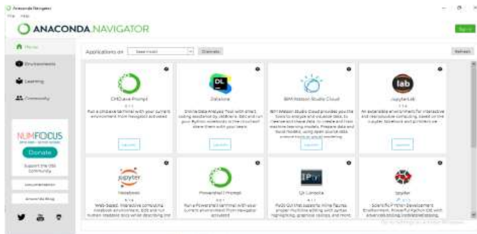
شكل 1 واجهة متصفح أناكوندا