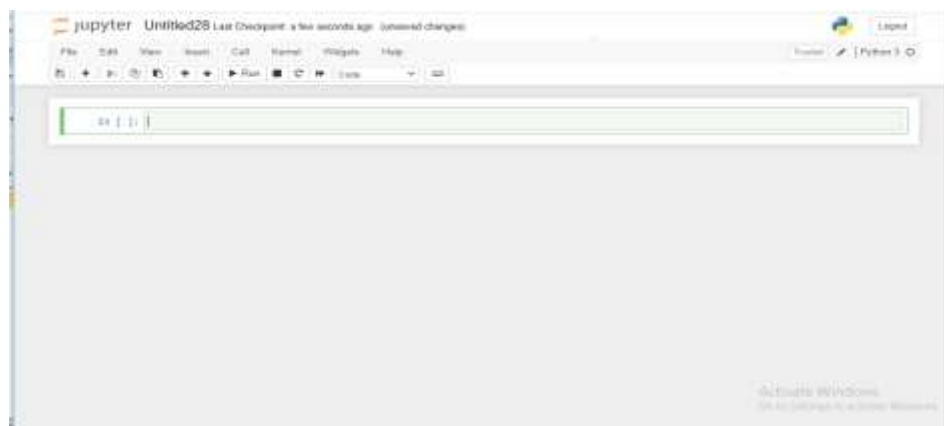
شكل 2 ملف notebook في برنامج أناكوندا