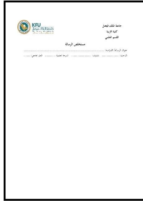
نموذج (٥) مستخلص الرسالة