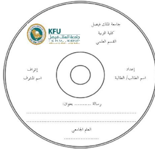
CD نموذج (٢) غلاف