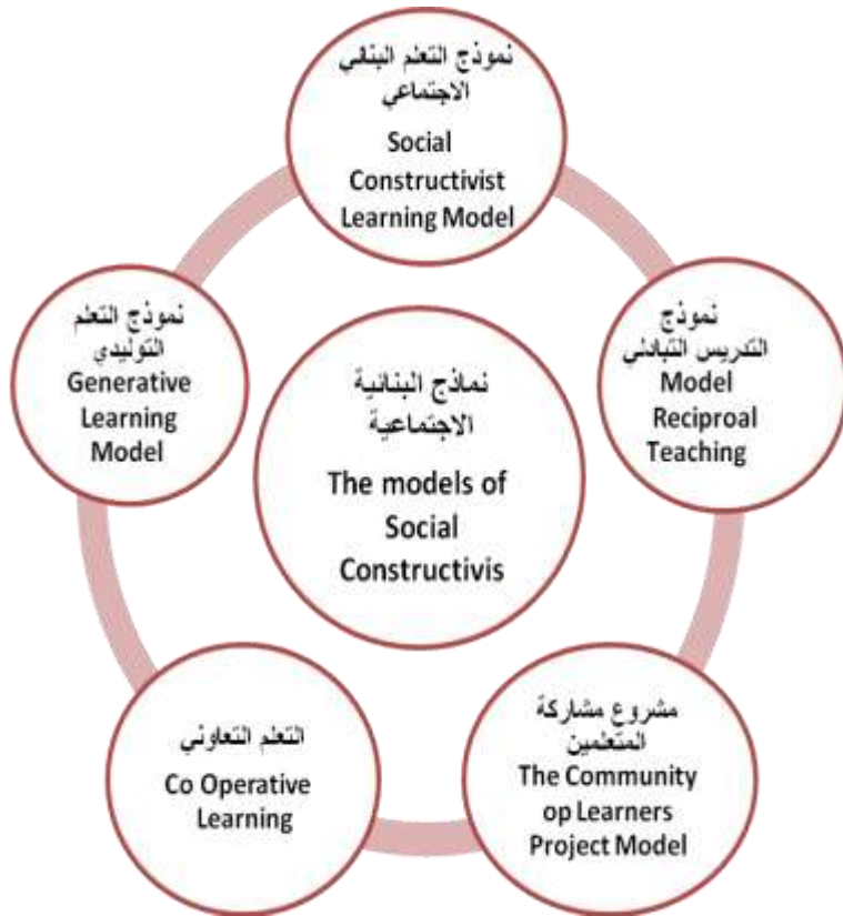
شكل يوضح نماذج واستراتيجيات البنائية الاجتماعية (إعداد الباحث)

وفى هذه المرحلة يقوم كل طالب بتقويم نفسه، كما تقوم كل مجموعة بتقويم ناتج عملها، ويتم ذلك من خلال تقويم ما توصلوا إليه من استنتاجات، وإيجاد تطبيقات مناسبة لما توصلوا إليه من حلول في مواقف جديدة، وتنفيذ هذه التطبيقات علمياً، كما تعنى التعرف على ما تحقق من أهداف، والنواحي الايجابية والسلبية لعملية التعلم. ويمكن توضيح النماذج والاستراتيجيات التطبيقية للبنائية الاجتماعية، من خلال الشكل التالي: