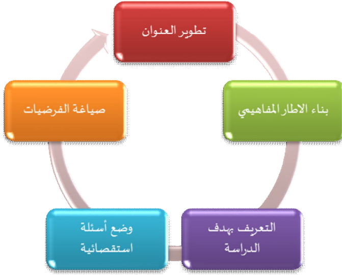
(شكل 1 مراحل صياغة المشكلة) (منذر الضامن، 2006: ص70)